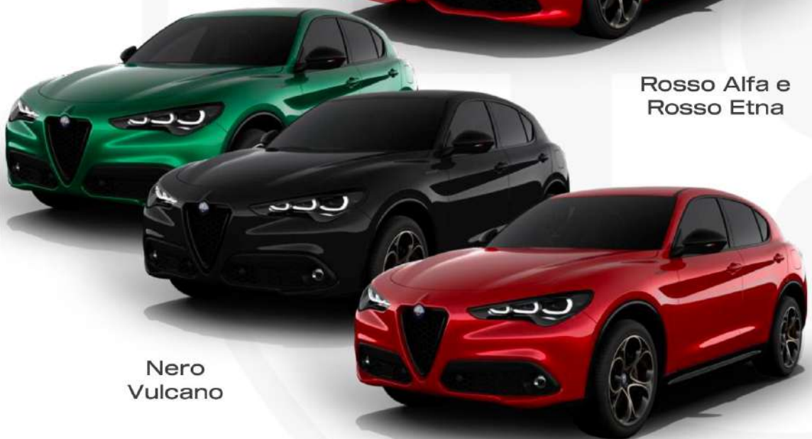
Rosso Alfa e Rosso Etna