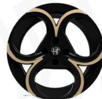
Cerchi in lega da 18" diamantati neri con finiture dorate