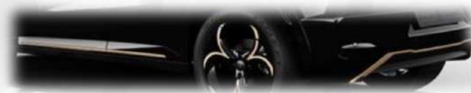
Body kit nero lucido con dettagli dorati